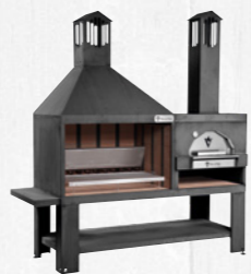
Art. VCKTF980N Nero