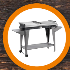
BARBECUE A GAS GAS BARBECUE pag. 12