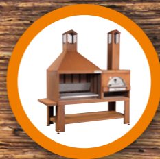
MONOBLOCCO MONOBLOC pag. 8