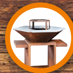
BARBECUE ESAGONALE EXAGONAL BBQ pag. 6