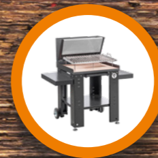
BARBECUE BBQ pag. 10