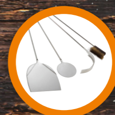
ACCESSORI ACCESSORIES pag. 18-19