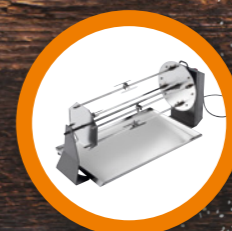
GIRRARROSTO ROTISSERIE pag. 16