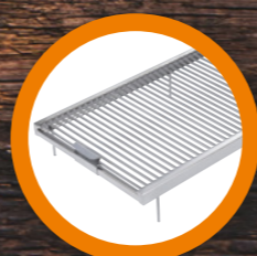
GRIGLIE & COPERTURE COOKING GRID & COVERS pag. 17