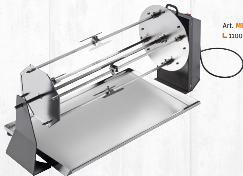
Art. MEAT-FIRE 1100 L 1100 x 280 x h380 mm

Electric rotisserie suitable for the fireplace VCKT860 / VCKT740. It is produced in a professional way using high quality materials. It is a product completely made in Italy produced to last for long time.