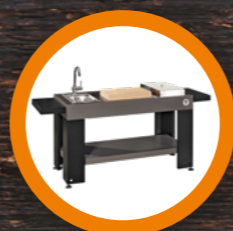
PIANO DI LAVORO WORKTOP pag. 14