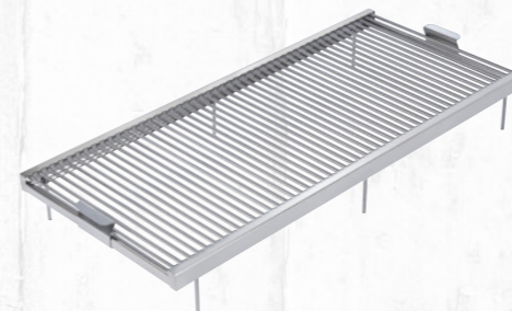
Griglia di cottura in acciaio inox AISI 304 con tondino Ø 8 brillantata. Stainless steel AISI 304 cooking grid with polished rounded bar Ø 8.

Art. VCKAT470 _ L 470 x 1100 mm Art. VCKAT420 _ L 420 x 880 mm Art. VCKAT370 _ L 370 x 660 mm