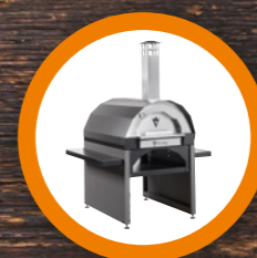
FORNO PIZZA PIZZA OVEN pag. 13