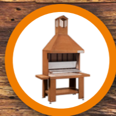
CAMINETTI FIREPLACE pag. 4 - 5