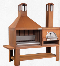
Art. VCKTF980C Corten