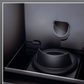
Braciere in ghisa