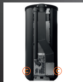
Scarico Coassiale Poujolat C Uscita Canalizzazione