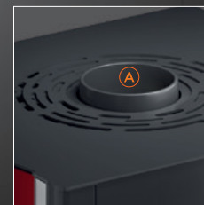
A Uscita fumi superiore

Tutte le immagini sono inserite a scopo illustrativo. I prodotti possono subire modifiche.