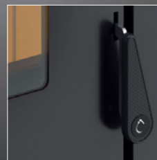
Maniglia anti scottatura