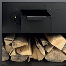
Cassetto cenere e vano porta legna