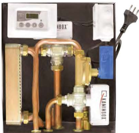
Dimensioni 13,5 x 31 x 32 cm (PxBxH)