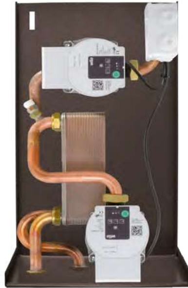
Dimensioni 25 x 30,5 x 51 cm (PxBxH)